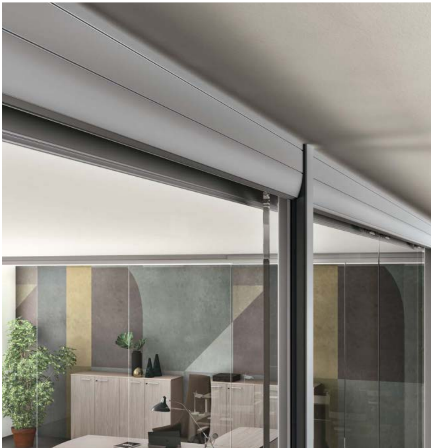
Esempio di profilo orizzontale h.8 cm adatto ad accogliere i meccanismi per la movimentazione delle porte scorrevoli ed a fianco esempio di nodo a tre vie con giunto in policarbonato trasparente. Example of a horizontal profile h.8 cm suitable for housing the mechanisms for moving the sliding doors and alongside an example of a three-way node with a transparent polycarbonate joint. Exemple de profil horizontal h.8 cm approprié pour loger les mécanismes de déplacement des portes coulissantes et à côté d'un exemple de nœud à trois voies avec joint en polycarbonate transparent.