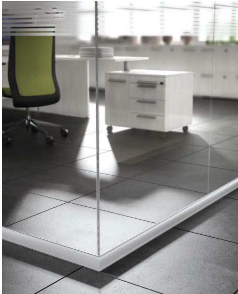
Angolo a due vie e serigrafia su vetro trasparente. Two-way corner and screen printing on transparent glass. Coin bidirectionnel et sérigraphie sur verre transparent.

GLASS WIND THE INTERIOR SURFACES. VERRE VENT LES SURFACES INTERIEURES.