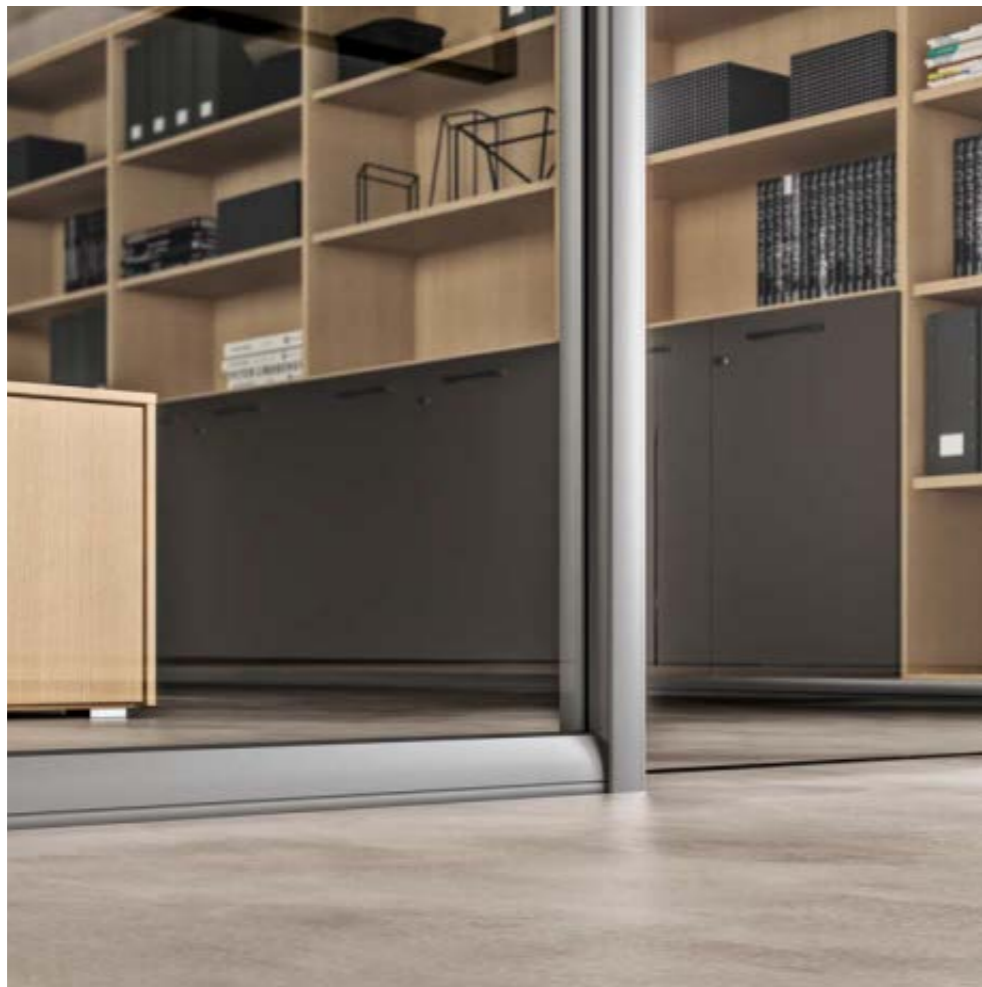
Esempio di profilo orizzontale h.5 cm e di profilo verticale per porta battente. Example of horizontal profile h.5 cm and vertical profile for hinged door. Exemple de profil horizontal h.5 cm et de profil vertical pour porte battante.

BRIGHT AND LIVING INTERIOR. INTÉRIEUR BRILLANT ET VIVANT.